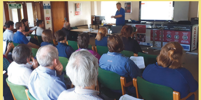
Digwyddiad hyfforddiant i Filfeddygon ynghylch ar Adolygiad Iechyd a Lles a gynhaliwyd ym mis Hydref.